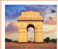
♥♦♦ India Gate