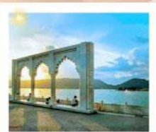
Ana Sagar Lake