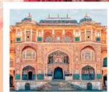
♥♦♦ Amber Fort