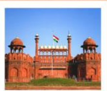
♥♦♦ Agra Fort