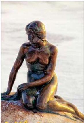
The Little Mermaid

รับประทานอาหารกลางวัน ณ RESTAURANT VITA (15) หรือเทียบเท่า