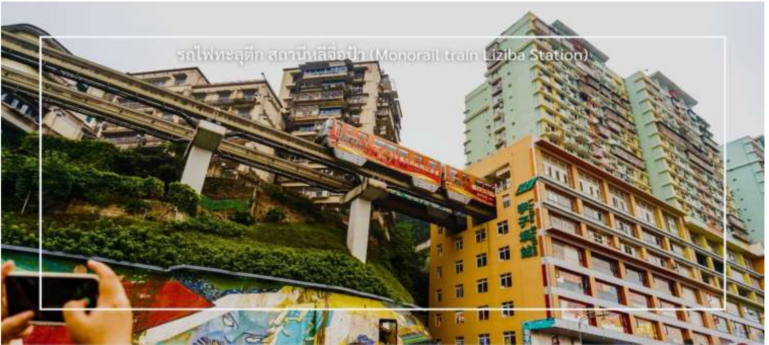
รถไฟทะลุถ้ำ สถานีหลี่จื่อป้า (Monorail train Liziba Station)

จากนั้นเดินทางไปยัง ตลาดหงหยาดัง (Hongyadong) หรือที่เรียกว่า "Hongya Cave" เป็นสถานที่ท่องเที่ยวที่มีชื่อเสียงในเมืองฉงชิ่ง โดยตั้งอยู่ริมแม่น้ำแยงซี มีบรรยากาศที่เต็มไปด้วยวัฒนธรรมและประวัติศาสตร์ ตลาดหงหยาดังเป็นพื้นที่ที่มีอาคารแบบดั้งเดิมที่สร้างขึ้นในสไตล์สถาปัตยกรรมแบบซิโน-ทิเบต โดยมีร้านค้า ร้านอาหาร และบาร์จำนวนมาก ที่นี่ท่านสามารถลิ้มลองอาหารรสเด็ดและชมพื้นเมืองอื่นๆที่ขึ้นชื่อ ตลาดหงหยาดังยังมีวิวทิวทัศน์ที่สวยงามสามารถเดินเล่นตามทางเดินที่มีการจัดแสดงงานศิลปะและสินค้าท้องถิ่น