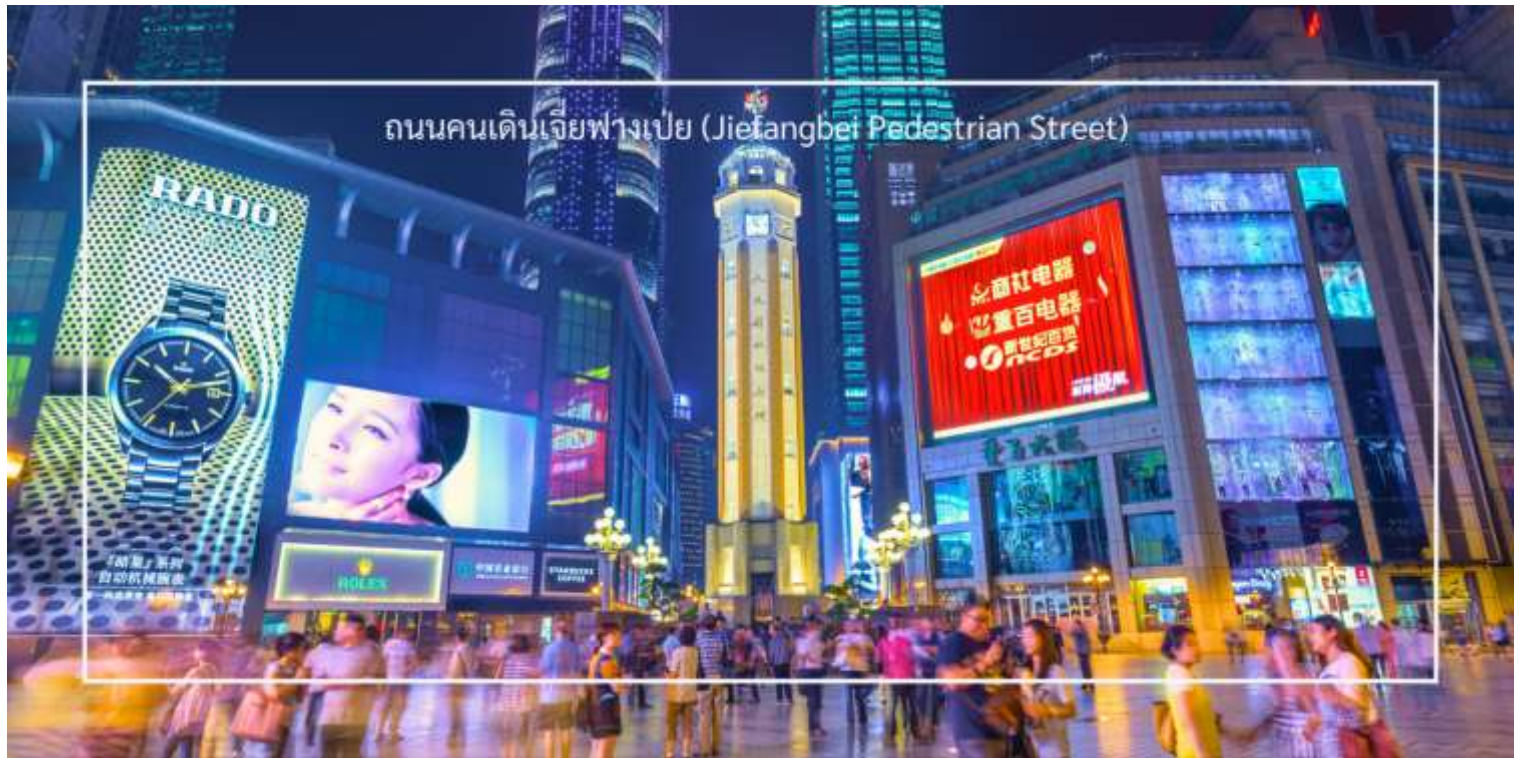
ถนนคนเดินเจียงเป่ย์ (Jiefangbei Pedestrian Street)

และการแสดงต่างๆ ที่ทำให้บรรยากาศน่าสนใจยิ่งขึ้น และยังเต็มไปด้วยร้านค้าแบรนด์เนม ร้านค้าท้องถิ่น และตลาดที่ขายสินค้าต่างๆ เช่น เสื้อผ้า เครื่องประดับ และของที่ระลึก แวะชมร้าน POP MART ร้านดังจากจีน ที่รวมฟิกเกอร์ดีไซน์เก๋และตุ๊กตาน่ารักหลากหลายซีรีส์ยอดนิยม เช่น Molly, Dimoo, Labubu และอีกมากมาย ที่สายสะสมของเล่นไม่ควรพลาด