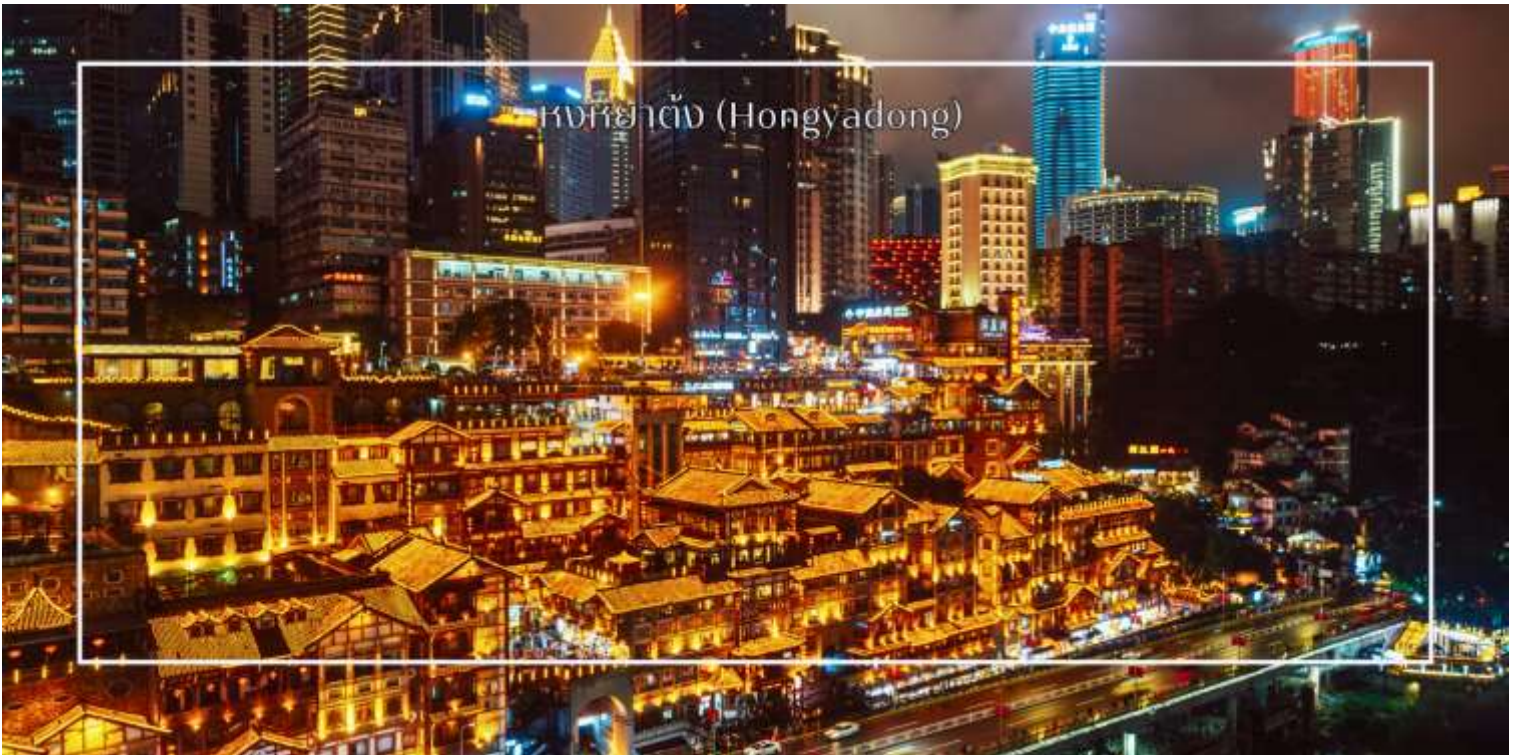
หงหยาดัง (Hongyadong)

จากนั้นเดินทางไปยัง ตลาดหงหยาดัง (Hongyadong) หรือที่เรียกว่า "Hongya Cave" เป็นสถานที่ท่องเที่ยวที่มีชื่อเสียงในเมืองฉงชิ่ง โดยตั้งอยู่ริมแม่น้ำแยงซี มีบรรยากาศที่เต็มไปด้วยวัฒนธรรมและประวัติศาสตร์ ตลาดหงหยาดังเป็นพื้นที่ที่มีอาคารแบบดั้งเดิมที่สร้างขึ้นในสไตล์สถาปัตยกรรมแบบซิโน-ทิเบต โดยมีร้านค้า ร้านอาหาร และบาร์จำนวนมาก ที่นี่ท่านสามารถลิ้มลองอาหารรสเด็ดและชมพื้นเมืองอื่นๆที่ขึ้นชื่อ ตลาดหงหยาดังยังมีวิวทิวทัศน์ที่สวยงามสามารถเดินเล่นตามทางเดินที่มีการจัดแสดงงานศิลปะและสินค้าท้องถิ่น