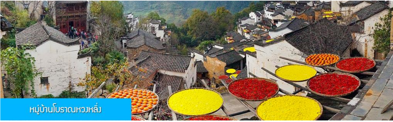
หมู่บ้านโบราณหวงหลิ่ง