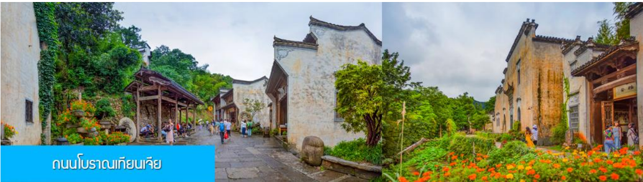
ถนนโบราณเทียนเจีย