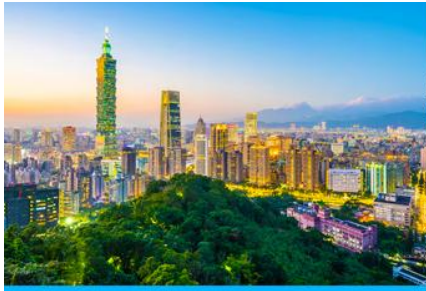
เมืองหวงชาน