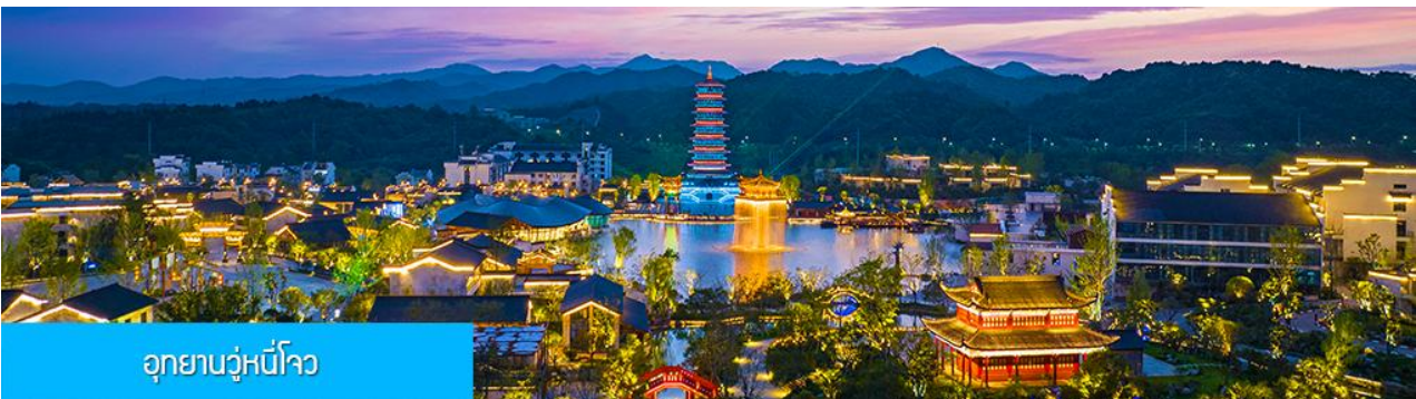
อุทยานวู่หนี่โจว

หลังอาหารนำท่านนั่งกระเช้าลงจากหมู่บ้านหวงหลิ่ง นำท่านขึ้นรถบัสเดินทางสู่อุทยานวู่หนี่โจว