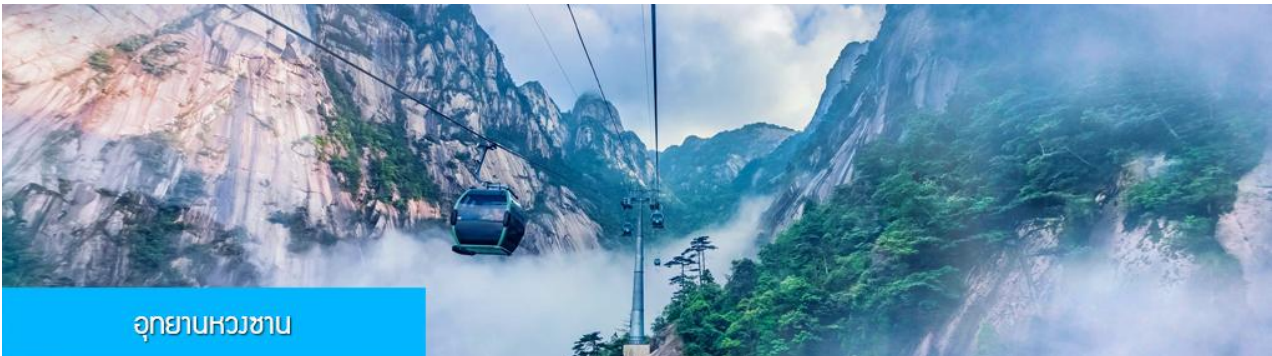
อุทยานหวงซาน