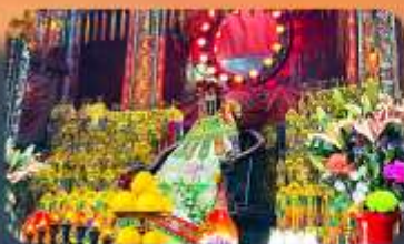
เจ้าแม่กวนอิมสองฮา