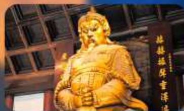
วัดเซ่งกงหมิว