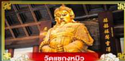
วัดเขangkทิว