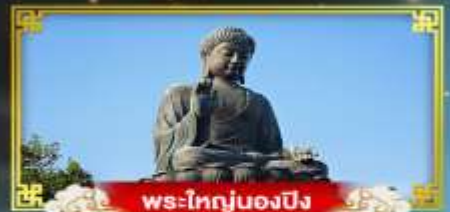
พระใหญ่ของปิง