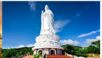
วัดลินห์ฮิ่ง

*ทางบริษัทฯ ขอสงวนสิทธิ์ในการสลับโปรแกรมทัวร์ตามความเหมาะสมขึ้นอยู่กับสถานการณ์หน้างาน โดยคำนึงถึงผลประโยชน์ของลูกค้าเป็นสำคัญ