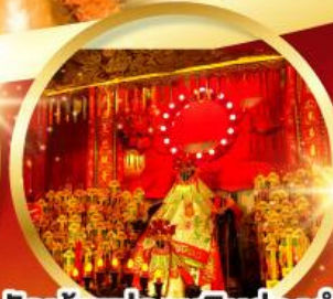
วัดเจ้าแม่กวนอิมฮ้องฮำ