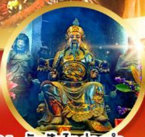
วัดปักไต้ฮ้องฮำ