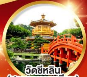
วัดซีหลิน (สวนหนานเท่หลิน)