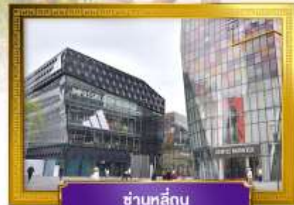
ชานหลู่กู่