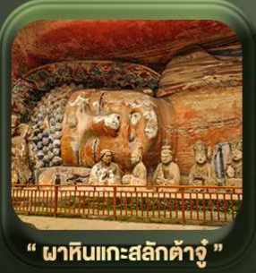
“ พาหินแกะสลักต้าจู้ ”