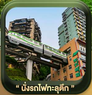
“ นั้รทไฟทะลุดัก ”

บินตรงลงวงซิ่ง • อุ้หลง หลุมฟ้าสะพานสวรรค์ • ระเบียงแก๊ว • อุทยานเขานางฟ้า หงหยาดัง • นั้รทไฟทะลุดัก • ศาลาประชาคม (ด้านนอก) • หลงหมินฮ่าว มรดกโลกพาหินแกะสลักต้าจู้ • วัดหลว้ออัน • ตักตะเกียบ • ถนนคนเดินเจียฟ้างเป่ย