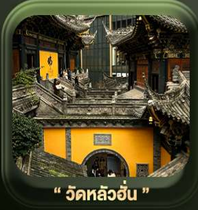
“ วัดหลว้ออัน ”