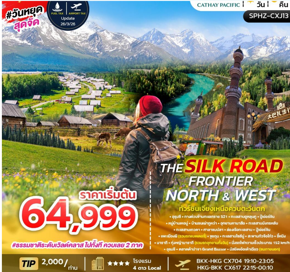
SPHZ-CXJ13 THE SILK ROAD FRONTIER – NORTH & WEST 9 วัน 7 คืน เดินทางด้วยสายการบิน Cathay Pacific (CX)