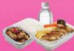
บริการอาหารร้อนบนเครื่อง ซาโป - ซากสึบ