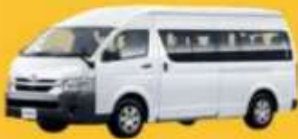
VAN (2-8 ท่าน)