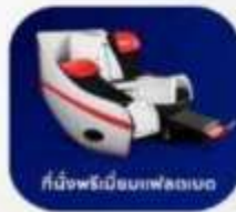
ที่นั่งพนักมือบนเฟลทเบด