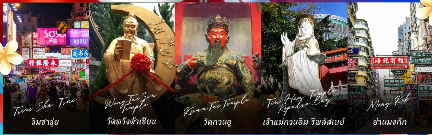
Tsim Sha Tsui จิมซาจุ่ย

รายการทัวร์ข้างต้นอาจมีการปรับเปลี่ยนเพื่อความเหมาะสม