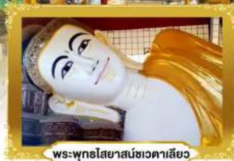
พระพุทธรูปไสยาสน์ชเวตาเลียว