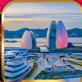
Zhuhai Opera House