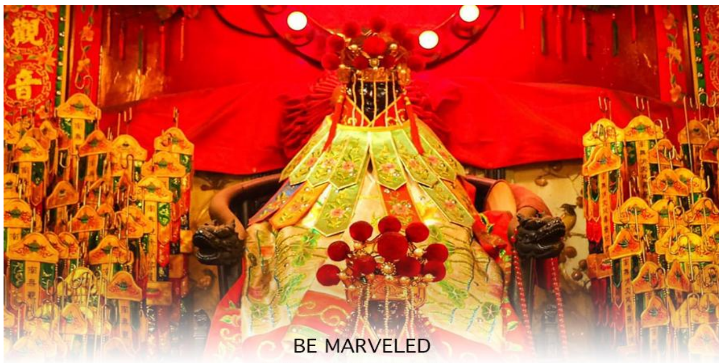
วัดเจ้าแม่กวนอิมสองอำ (ฮิมฮิน)

จากนั้นนำท่านสู่ เจ้าแม่กวนอิม วัดสองอำ (HUNG HOM KWUN YUM TEMPLE) เป็นหนึ่งในวัดที่เก่าแก่ที่สุดของฮ่องกง และชาวฮ่องกงเลื่อมใสศรัทธามาก สร้างขึ้นในปี ค.ศ.1873 ในสมัยช่วงสงครามโลกครั้งที่ 2 มีการปล่อยระเบิดลงบริเวณใกล้กับวัดแห่งนี้หลายต่อหลายครั้ง ทำให้มีผู้บาดเจ็บและล้มตายมากมาย แต่ชาวบ้านที่หนีเข้าไปหลบภัยในวัดนี้ก็กลับปลอดภัยอย่างปาฏิหาริย์ และตัววัดก็ไม่ได้รับความเสียหายจากเหตุการณ์ที่ระเบิดอย่างน่าอัศจรรย์ ตามความเชื่อของคนจีนใน ฮ่องกง-มาเก๊า จะมี "วันเปิดทรัพย์" หรือ "พิธียืมเงิน เจ้าแม่กวนอิมฮ่องกง" เป็นวันที่จะมาขอพรและยืมเงินเจ้าแม่กวนอิม ซึ่งนับจากหลังวันตรุษจีน ไป 26 วัน จะเป็นวันเปิดทรัพย์ที่จัดขึ้นในทุกๆปี พิธีนี้จะมีเพียงครั้งปีละครั้งเท่านั้น เป็นวันสำคัญอีกวันที่คนหลังไหลมาไหว้ขอพรอย่างไม่ขาดสาย