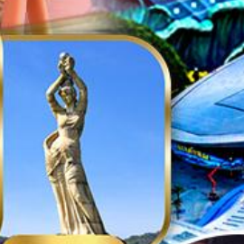
จูไห่ฟิชชอร์ทิวรา