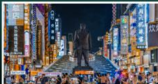
ถนนแดนเดินเขาวงกต