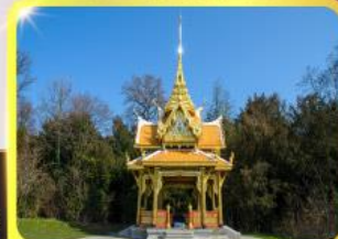
ศาลาไทยไชยานท์