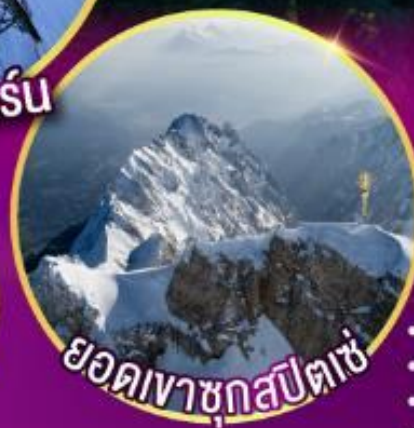
ยอดเขาชุกสปีตซ์