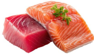
● เนื้อปลาดิบ