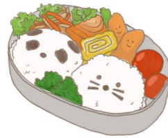
● อาหารสำหรับเด็ก ( 2-11 ปี ) *วัตถุดิบขึ้นอยู่กับทาวร้าน