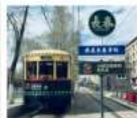
นั่งรถรางฉางชุน