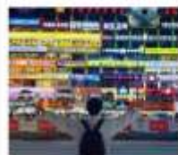
กำแพงมหาวิทยาลัยเหอหนาน