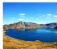
ฉางไป่ซาน