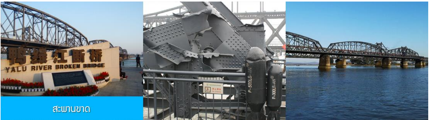
สะพานขาด