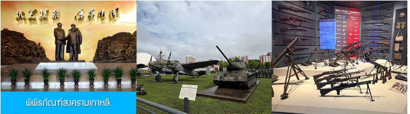
พิพิธภัณฑ์สงครามเกาหลี