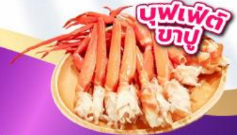
บุฟเฟ่ต์ ซาซิมิ