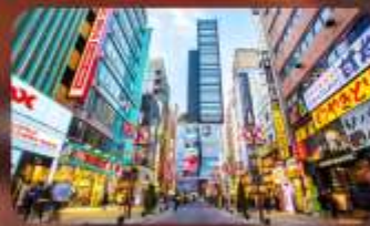
ซ้อปิ้งชินจูกุ