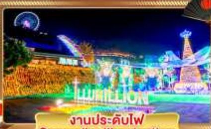
งานประดับไฟ Sagami Illumination