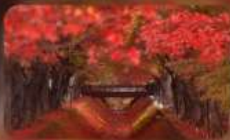
อุโมงค์เมเปิ้ลโมมิจิโคโร