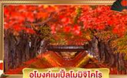
อุโมงค์เมเปิ้ลโมมิจิโคโระ