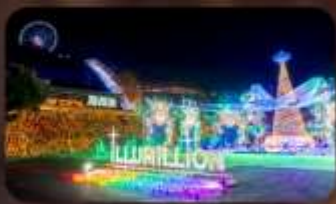
งานประดับไฟ Sagami Illumination