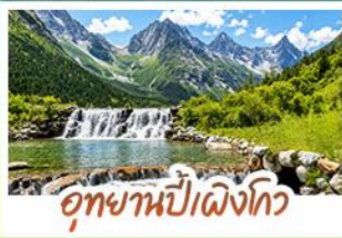
อุทยานปี่ฝิ่งโกว