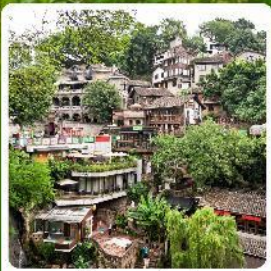
ตรอกโบราณเซี่ยฮ่าวหลี่