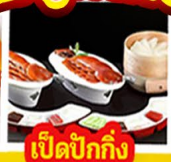
เปิดปิ้งกั๊ง