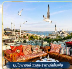
มุขโหลยาลิส วิวสุเหร่าฮาเกียโซเฟีย

ช่องแคบบอสฟอรัส • สุเหร่าสีน้ำเงิน • สุเหร่าฮาเกียโซเฟีย