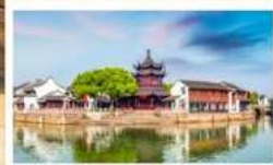
บรรยากาศเมืองน้ำซูโจว