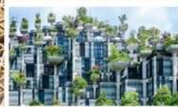
ตึกต้นไม้ 1000 ต้น