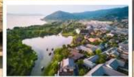
หมู่บ้านเหนียนฮิววาน

🧳 โหลด 23 KG. x1 ทั้งไป - กลับ ✓ พรีเมียมทิวทัศน์ ✓ ไม่เข้าร้านรัฐบาล ✓ ทิวทัศน์แปลก ✓ รวมค่าเข้าชมที่ตามโปรแกรม