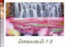
น้ำตกทะเลสาบไห่ 7 สี

🗳️ โหลด 23 KG. x1 ทิ้งไป - กลับ ✓ ฟรีนียบตัว ✓ ไม่เข้าร้านรัฐบาล ✓ ทิวทัศน์เล็ก ✓ รวมค่าเข้าสถานที่ตามโปรแกรม