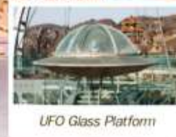
UFO Glass Platform