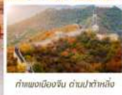
กำแพงเมืองจีน ด่านป่าต้าหลิ่ง