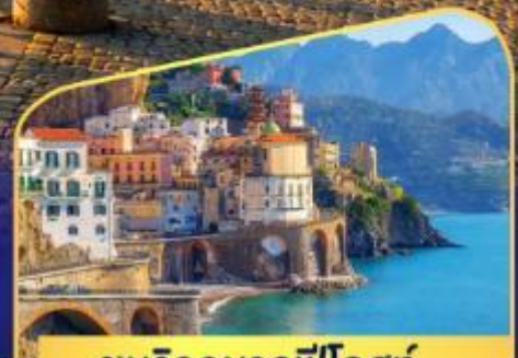
ชมวิวมอลฟีโคสก์