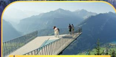
นั่งรถกระเช้าไฟฟ้า ฮาร์เตอร์ คูส์ม