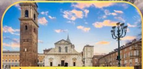
ถ่ายภาพกับมหาวิหารตูริน