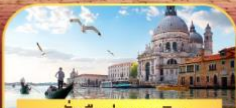
นั่งเรือสุทเกาะเวนิส