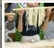
กิจกรรมทำเส้นอุด้ง