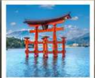
ศาลเจ้าอิตสึคุชิมะ