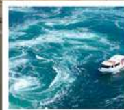
คลองเรือขมบ้านนาสุโตะ

วัดบึงขออน / ตลาดกิงงะ / โบสถ์โทกาวานี่ (จุดชมวิว) / สะพานคินไตเคียว เกาะมียาจิมา ศาลเจ้าอิตสึคุชิมะ / สวนอนุสรณ์สันติภาพฮิโรชิมา โดโกะออนเซ็น / ถนนโอโมเตะซันโด คมปีระซัง / ปราสาทตสึยามา กิจกรรมทำเส้นอุด้ง / สวนริทสึริน / สถานีรับทางคุรุกุรุมารุโตะ คลองเรือขมบ้านนาสุโตะ / ซุปบึงย่านชินโซบาชิ / ตลาดปลาคุโรเมง / ซุปบึงย่านอุเมะ