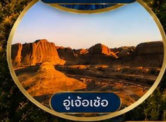
อู๋เจ้อเซ่อ