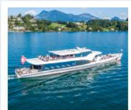
ล่องเรือทะเลสาบลูซีร์น