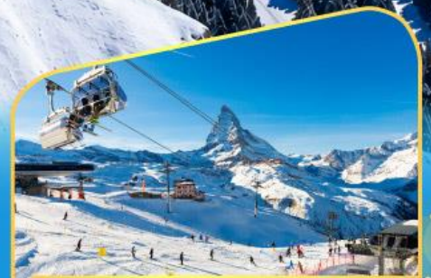
นั่งกระเช้าชมแมทเทอร์ฮอร์น