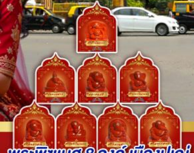
พระพิฆเนศ 8 องค์ เมืองปูเณ